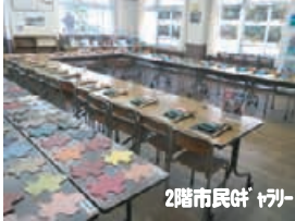
2階市民ギャラリー